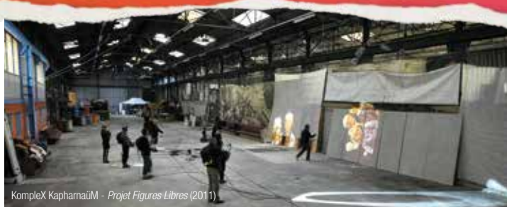
KompleX Kapharnaïm - Projet Figures Libres (2011)

Lieu de création pour les arts d'espace public à Amiens