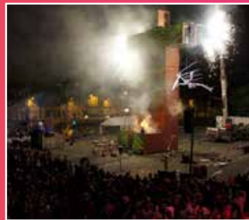
Waterlitz - Générif Vapeur (La Rue est à Amiens 2012)

Célia, Julien et Philippe qui ont imaginé cette programmation, et toute l'équipe qui met en œuvre le festival