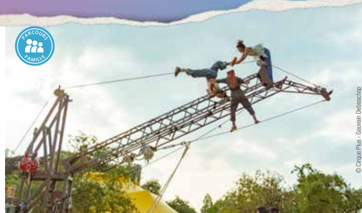
© Cirque Plus - Gauvain Delbischop